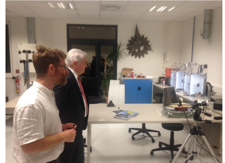
FabLab avec Imprimantes 3D