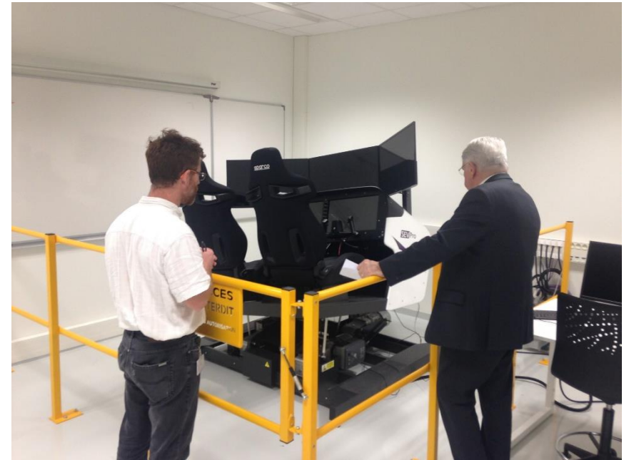
Salle « Simulateur de vol »