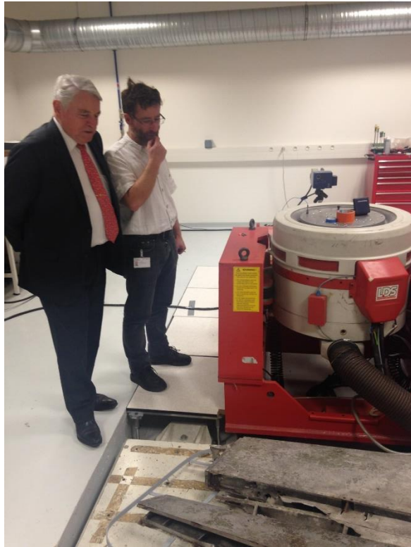
Salle avec pot vibrant